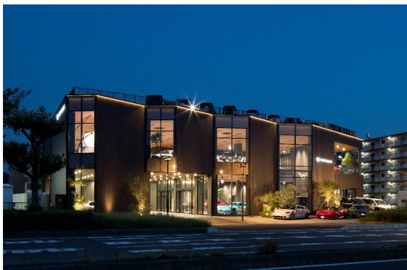
第56回(前回)グランプリ 「トップランク本店」

1970年より開催し、今年で57年目となるストアフロントコンクールでは、昭和フロントのアルミ建材を使用した施工例の中から優秀な作品を表彰し、発表することで、新たなストアフロントの可能性を示す役割を担ってまいりました。