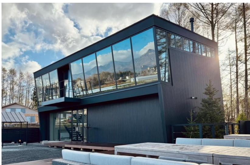
第55回(前回) グランプリ 「AICAFE VILLAGE PROJECT」

1970年より開催し業界最長を誇るストアフロントコンクールでは、昭和フロントのアルミ建材を使用した施工例の中から優秀な作品を表彰し、発表することで、新たなストアフロントの可能性を示す役割を担ってまいりました。