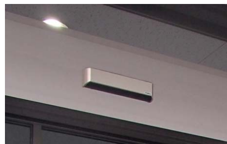
▲大型無目仕様 スッキリとした外観