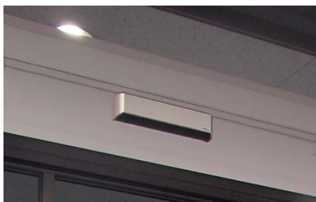
▲従来の無目段重ね仕様 中央に無目とお押縁のラインが見える