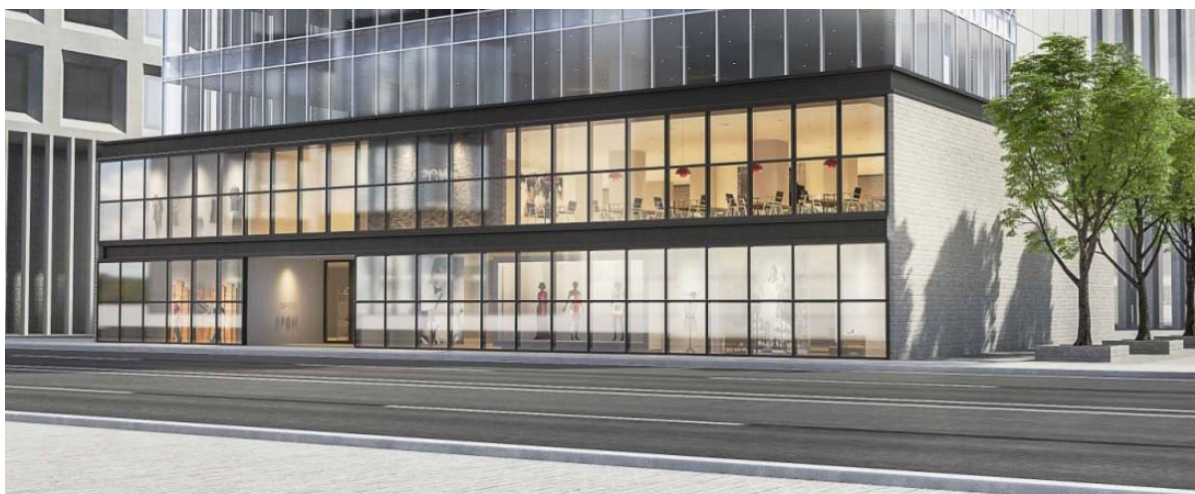
「ローライズX SPタイプ“複層ガラス仕様”」取付イメージ

昭和フロントでは、これからもお客様と社会のニーズに合わせた商品作りを行っていきます。